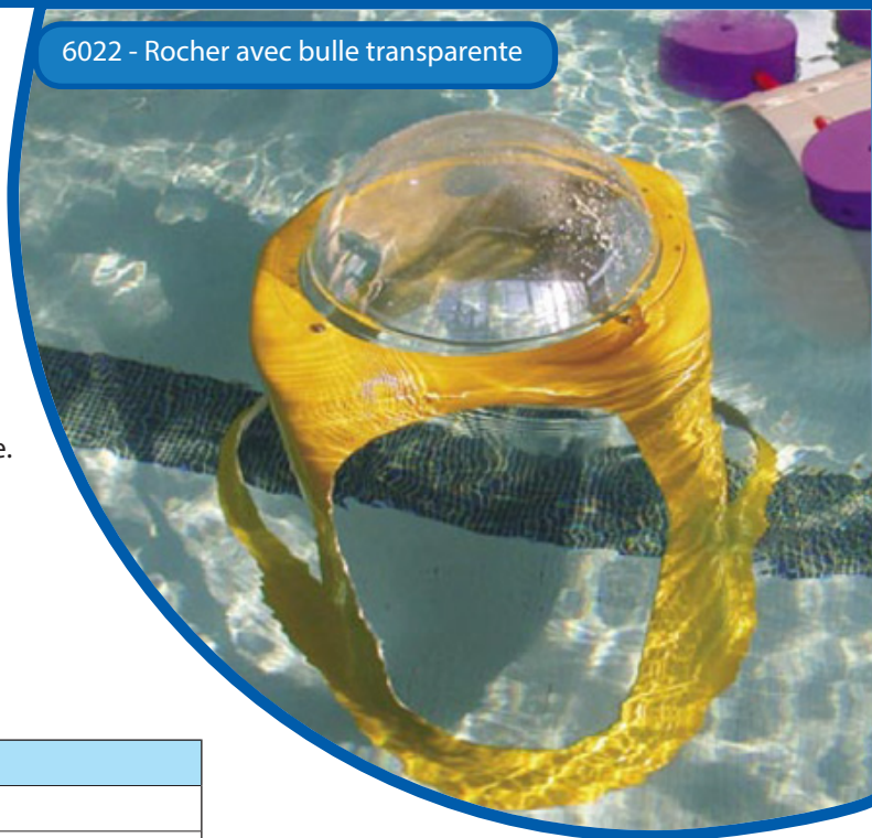
6022 - Rocher avec bulle transparente