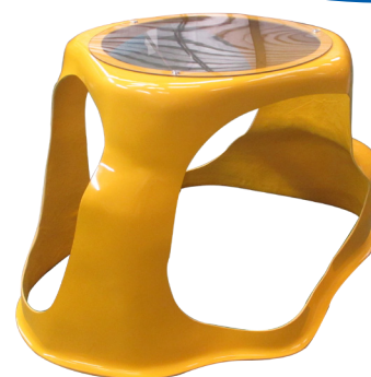
6020 - Rocher avec plaque transparente sur le dessus