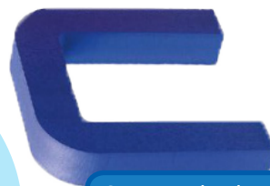
Support dos-bras carré