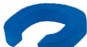
Support dos-bras rond