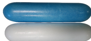
Flotteur en styropor - 300x90mm - 4989