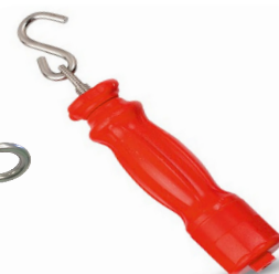
Tendeur ridoir à serrage manuel- 50228