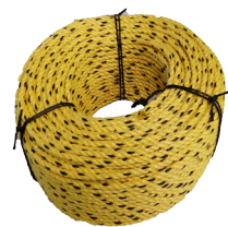
Corde polypropylène Ø6mm