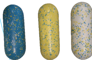
Flotteur en styropor - 148x59mm - 5000